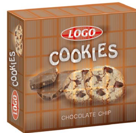
Mit dem Digimarc-Barcode wird der DTIN/EAN über die gesamte Packung wiederholt – auf sechseitigen Faltschachteln mehr als 200-mal. With the Digimarc barcode, the DTIN/EAN is repeated across the entire package – more than 200 times on a six-sided folded box.