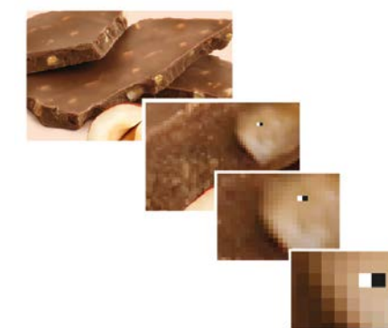
Dem Bildraum werden zusätzliche statistische Daten zugefügt. Diese wären selbst in Schwarzweiß nicht sichtbar. Dabei verändert der Algorithmus einzelne Farbpixel geringfügig so, dass das Wasserzeichen elektronisch auslesbar ist, aber unsichtbar bleibt. Additional statistical data is added into the image space. This wouldn't be visible even in black and white. The algorithm slightly changes individual colour pixels so that the watermark can be read electronically, but remains invisible.

Obwohl das System im Discountkanal wegen des Eigenmarken-Anteils am einfachsten umsetzbar wäre, dürfte der Nutzen hier geringer sein, da die Eigenmarken bereits fast allseitig mit Strichcodes versehen sind und so eine kaum zu beschleunigende Erfassung gegeben ist. Großen Nutzen ergibt der unsichtbare Rundum-Code wahrscheinlich vor allem im Self-Check-out: Hier wird der Abwicklungsprozess beschleunigt und ver-